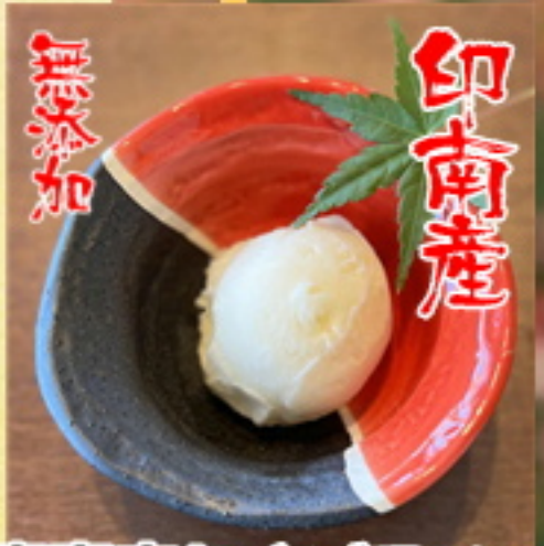
無添加 真産産わさびアイス 300円 330円込