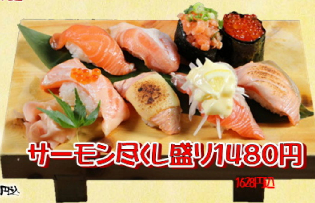
サーモン尽くし盛り1480円 1628円込