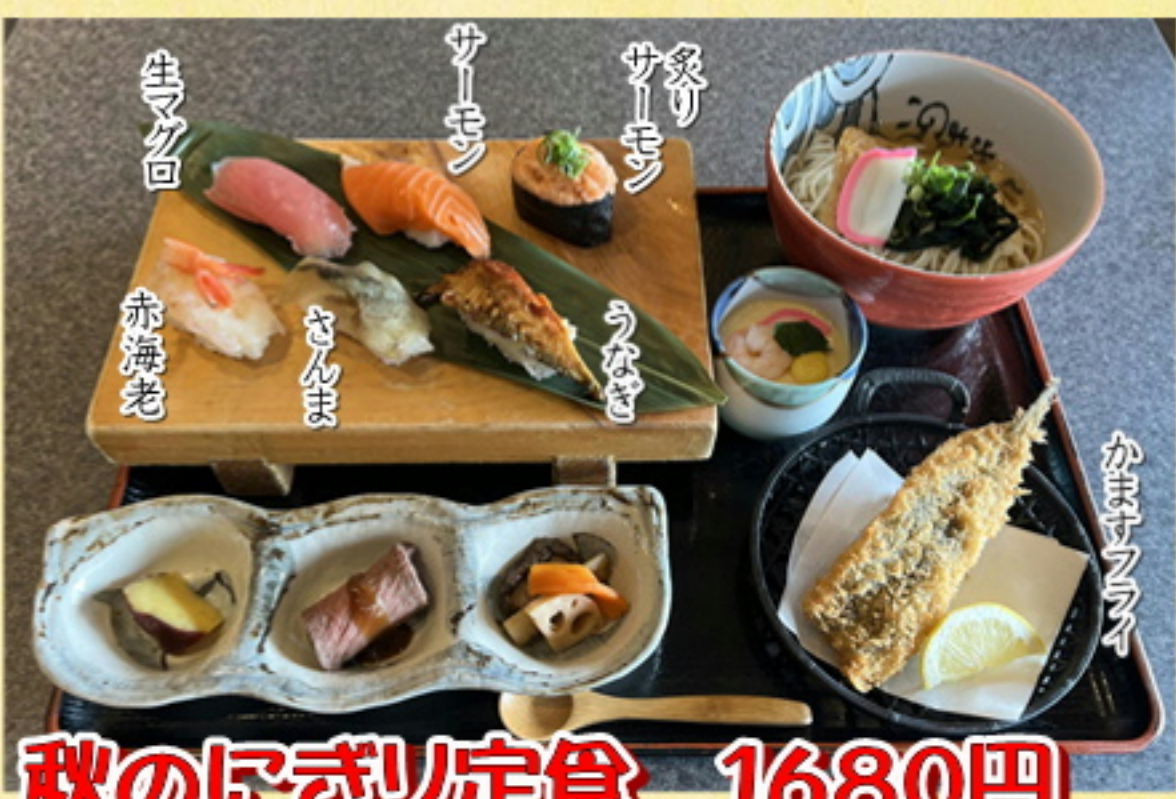
秋のにぎり定食 1680円 1848円込