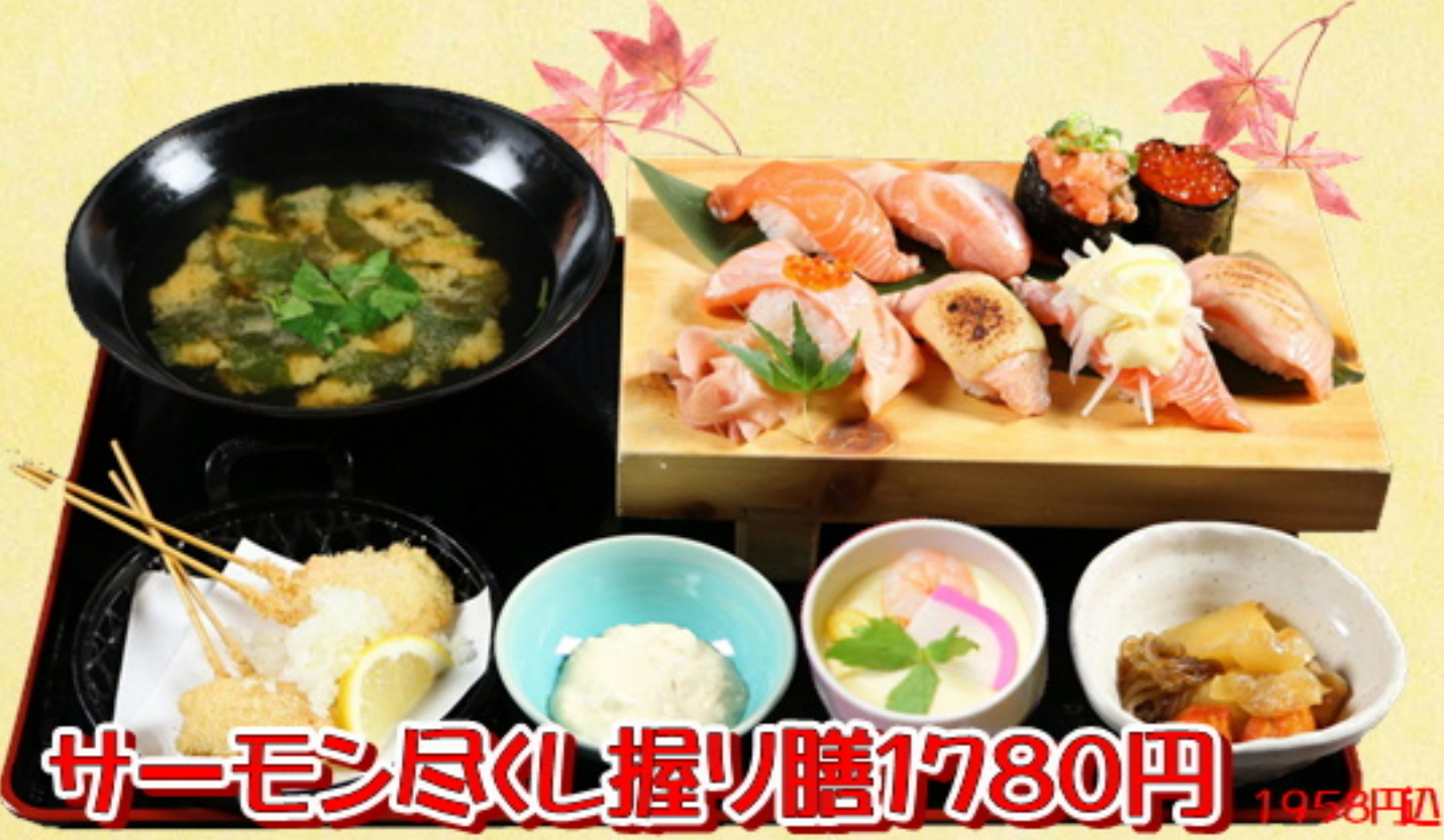
サーモン尽くし握り膳1780円 1958円込