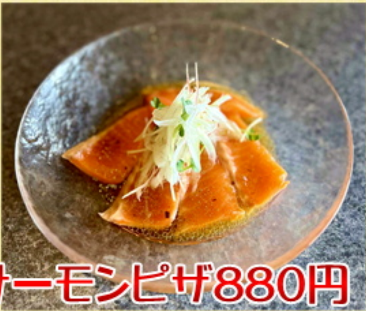
サーモンピザ880円 968円込