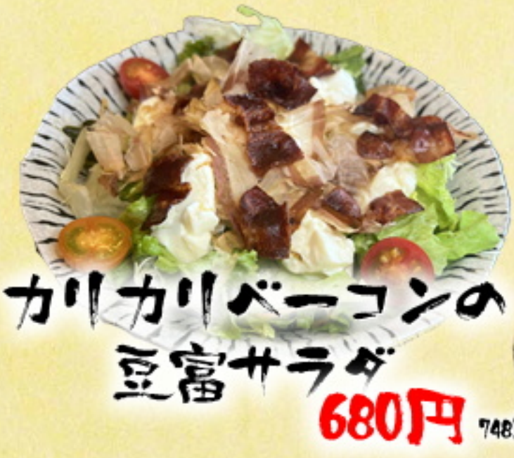
カリカリベーコンの 風富サラダ 680円 748円込