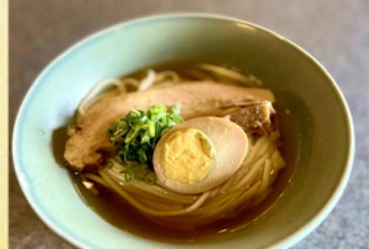
豚角煮五島うどん880円 968円込