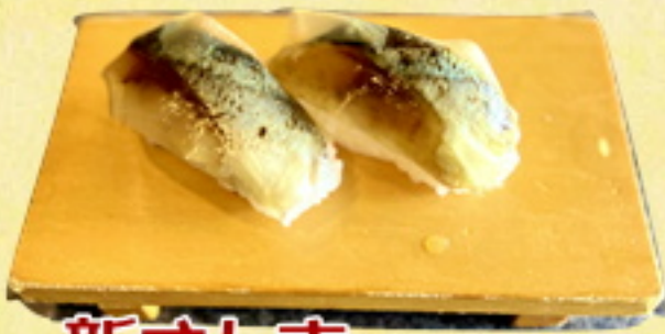
新さんま てら昆布のせ250円 275円込